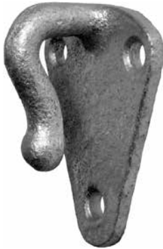
Art.-Nr.: 03403 A

Mat.: GTW, feuerverzinkt Breite: 40 mm, Höhe: 45 mm Ausladung: 23 mm